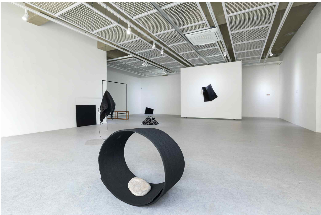
《글리치필릭》 1층 'Bug 공간' 전시 전경