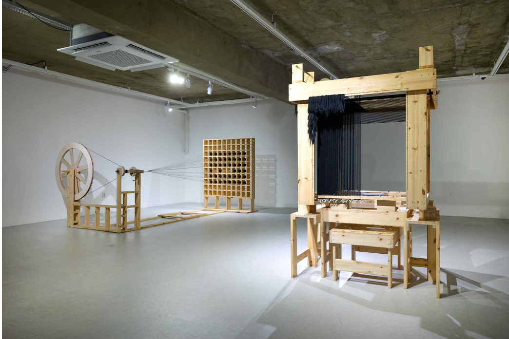
《글리치필릭》 지하 '3 Tools 공간' 전시 전경