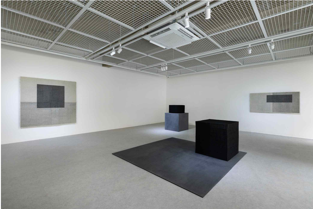
《글리치필릭》 1층 'Glitch 공간' 전시 전경